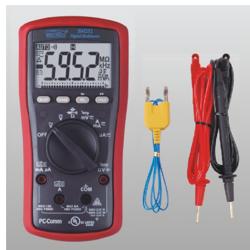
BM 252 z wyposażeniem standardowym